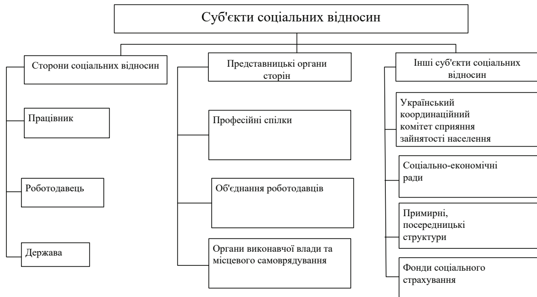
Рис. 1. Суб'єкти соціальних відносин

Визначимо місце держави як суб'єкта соціальних відносин. На рис. 1 представлено схему взаємодій суб'єктів (учасників) соціальних відносин у суспільстві.