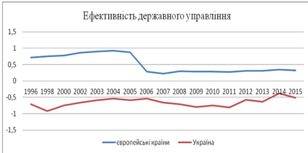
Рис. 1. Показники “Ефективність державного управління” в європейських країнах та Україні з 1996 по 2015 р.

Графік ілюструє для: європейських країн – позитивні, із 2007 р. практично стабільні значення показників із деякою позитивною динамікою, України – всі показники від’ємні, хоча з висхідною тенденцією з 2011 по 2014 р.